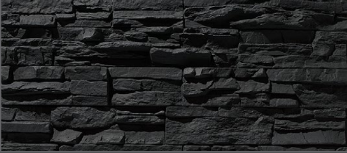
2400 Bruchstein | crushed stone