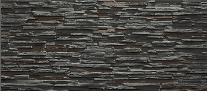
4200 schmal geriegelt | straight rippled