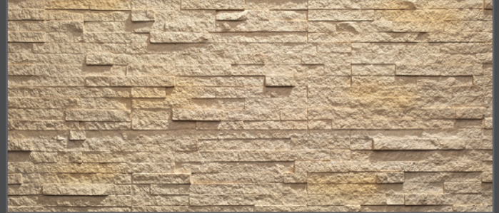
3300 breit geriegelt | wide rippled