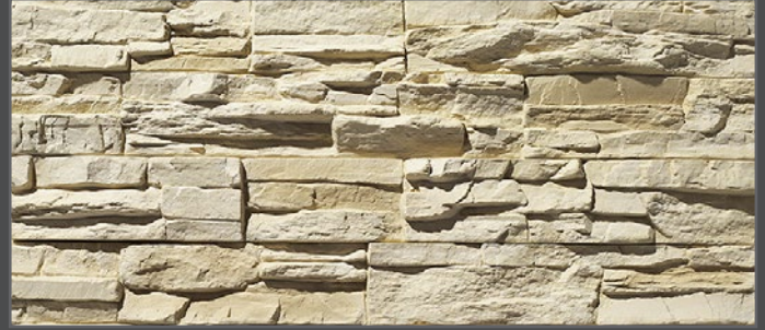
2300 Bruchstein | crushed stone