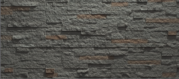
3200 breit geriegelt | wide rippled