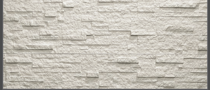
3100 breit geriegelt | wide rippled