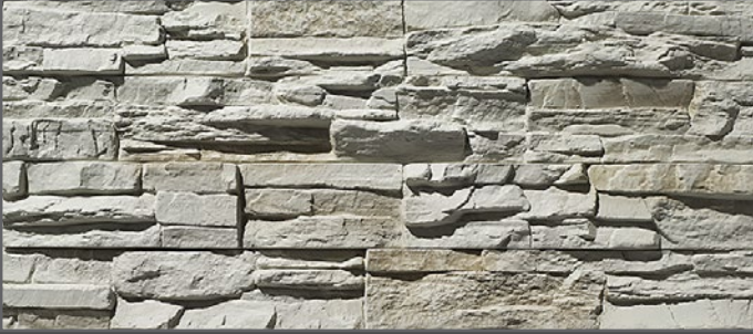
2000 Bruchstein | crushed stone